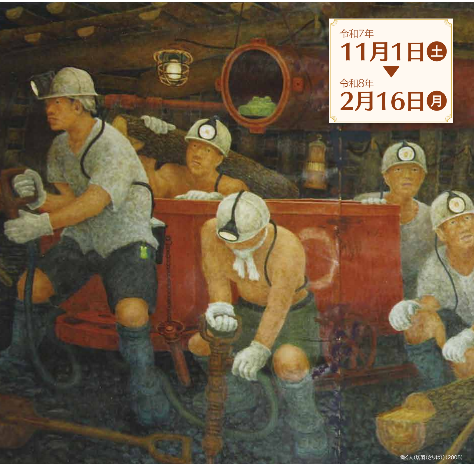
働く人(切羽(ぎりば)) (2005)