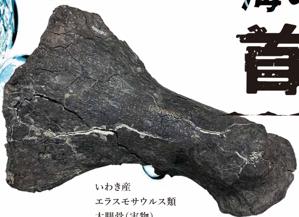
いわき産 エラスモサウルス類 大腿骨(実物)