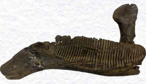
ハドロサウルス類 植物食恐竜の下顎(実物)