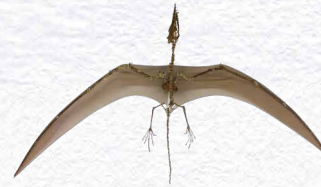
ランフォリンクス(実物)