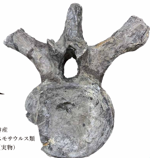
いわき産 エラスモサウルス類 椎骨(実物)

恐竜が陸上を支配していた中生代、海では恐竜とは異なるさまざまな「海生爬虫類」が繁栄していました。その中でも「首長竜」は非常に長い期間繁栄を続け、中生代を通じて「海の支配者」として君臨していました。