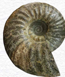
ユーバキディスカス【正常巻き】(実物)