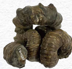
ニッポニテス【異常巻き】(実物)

化石の代表格として一般によく知られる「アンモナイト」。殻の巻き方によって「正常巻き」と「異常巻き」の2つのグループに分けられるんだ。アンモナイトを一堂に展示して、そのかたちの秘密に迫るよ。