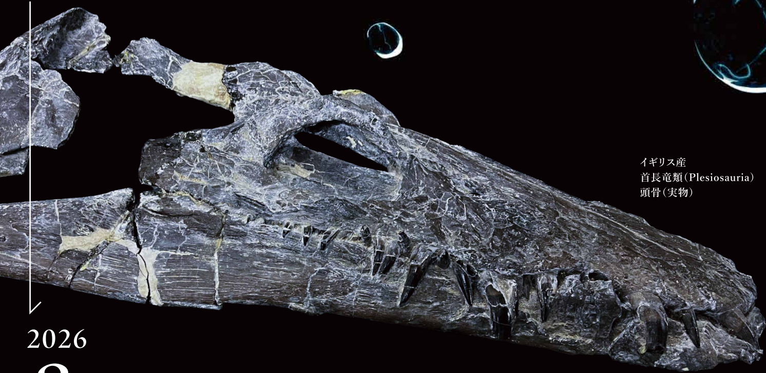
イギリス産 首長竜類 (Plesiosauria) 頭骨 (実物)