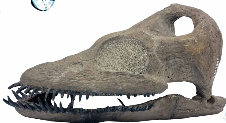
イギリス産 クリプトクリダス 頭骨(複製)