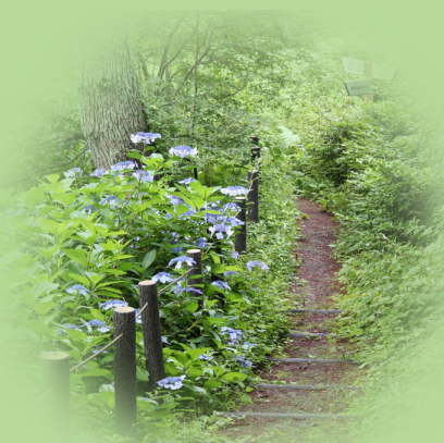
勿来の関公園 遊歩道