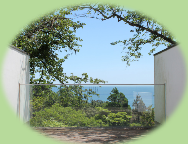
いわき市勿来関文学歴史館展望デッキ