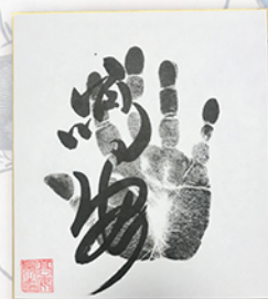
●力士直筆サイン例

お楽しみコーナー&抽選会も実施 開場直後からの力士四名による握手会のあと、力士に直接質問して大相撲の知識を深めていただける質問コーナーや、ご来場の皆様から抽選で20名様に、力士直筆サインや相撲土産が当たる、お楽しみ抽選会も行います。 巡業ならではの楽しい企画が盛りだくさんです。