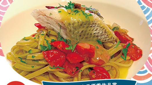
2024年度最優秀作品賞 「スズキと福島の恵みのスパゲッティ」