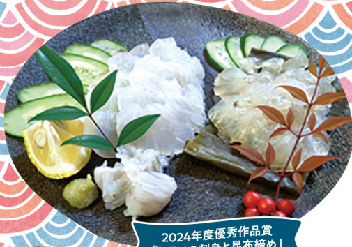
2024年度優秀作品賞 「ヒラメの刺身と昆布締め」