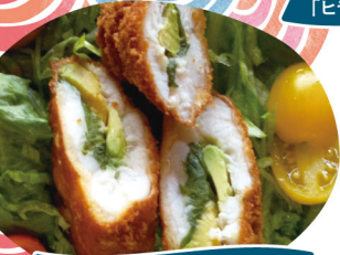
2024年度優秀作品賞 「フグとアボカドのはさみ揚げ」