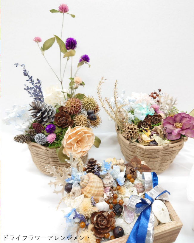
ドライフラワーアレンジメント