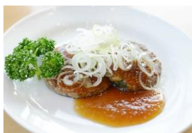
サンマのポーポー焼き（600円）