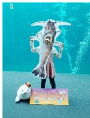
リアル生物顔はめパネル ナメダング（左）とダイオウキジエビ（右）