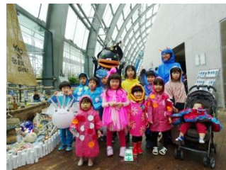
自作のギョスプレで 来館した子どもたち