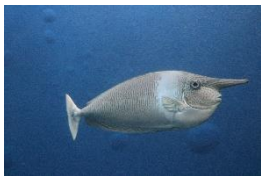
②ツマリテングハギ