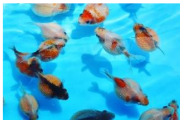
⑩ チョウチンパール