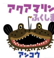
フェイスペイントシール