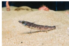
⑧マルアオメエソ （メヒカリ）