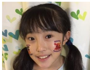
フェイスペイント