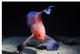
⑥ハゴロモコンニャクウオ