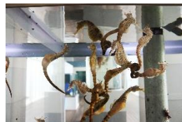
⑨ポットベリーードシーホース