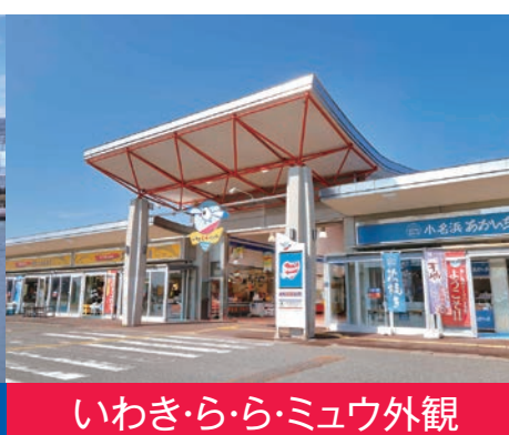
いわき・ら・ら・ミュウ外観