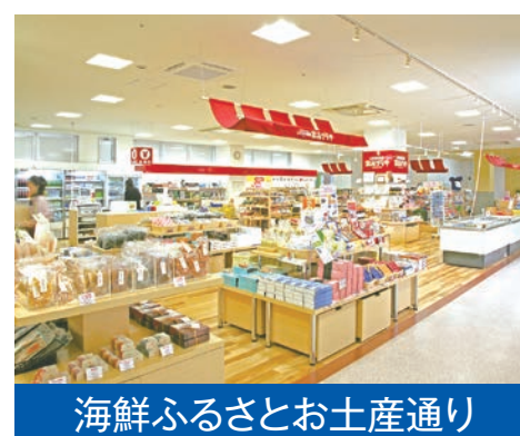
海鮮ふるさとお土産通り

●サービス・プレゼント内容及び条件については、各店のPOPなどをご参照ください。●各店舗のオープンよりイベント開始となります。●無くなり次第終了となります。 ※水揚げ状況により、いわき産以外のかつおを使用する場合がございます。