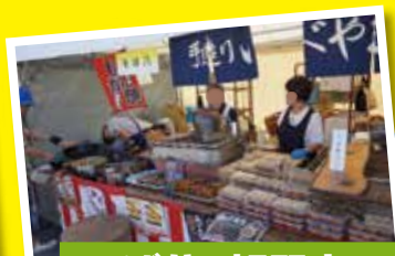
そば八 好間店 5/3~4