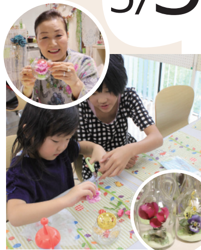
フラワースタジオ・ミヨコ