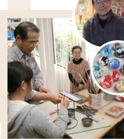
ガラス工房「きたの」