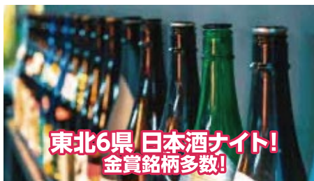
東北6県 日本酒ナイト! 金賞銘柄多数!