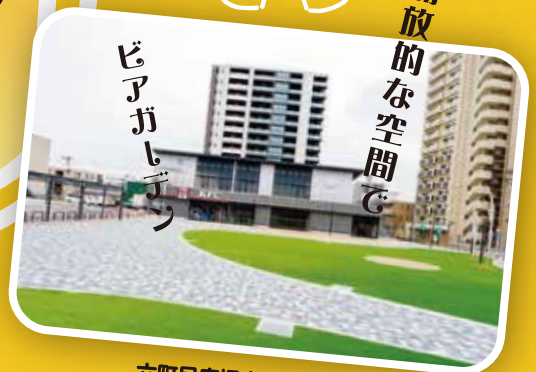
六町目広場 (Paix Paix)