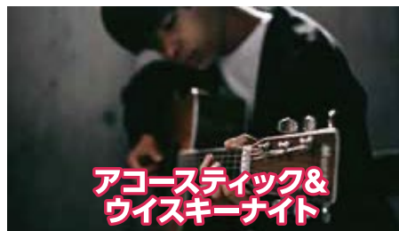
アコースティック& ウイスキーナイト