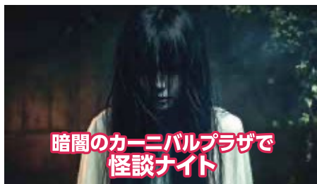
暗闇のカーニバルプラザで 怪談ナイト