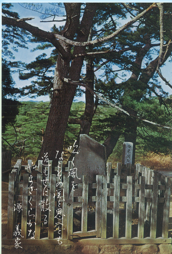
源義家歌碑を写した絵はがき（左：大正時代、右：昭和50年代）